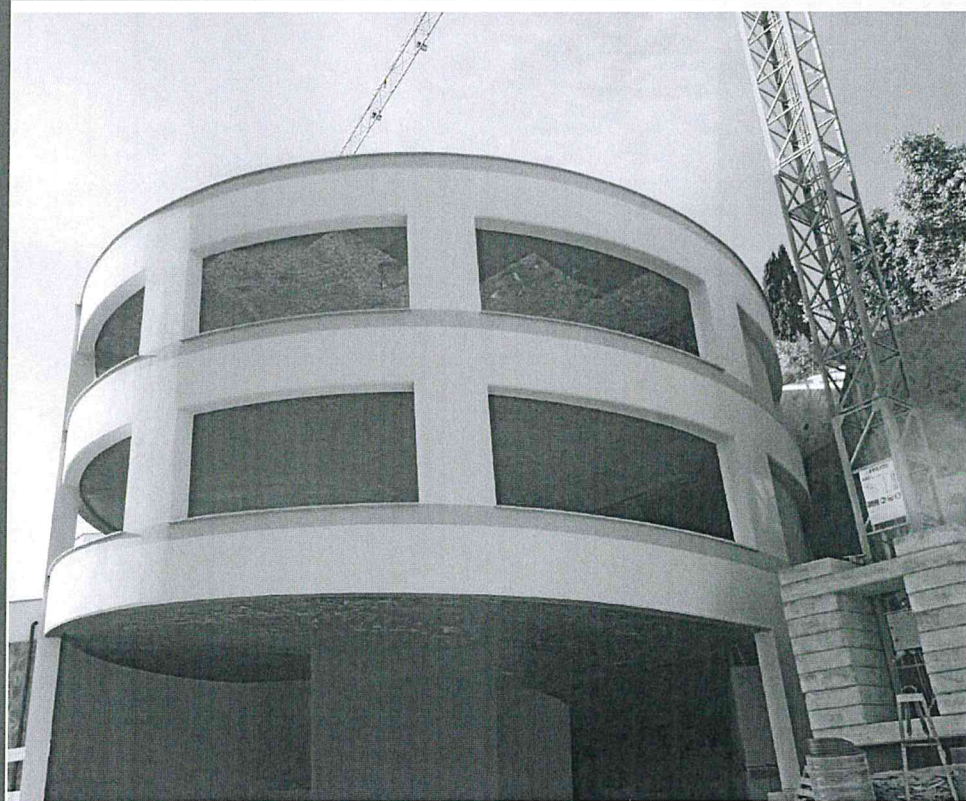
TRAVE VIERENDEEL CURVA Campata 22m - massima 1000kg / mq Calcolo di modellazione agli elementi finiti (FEM)