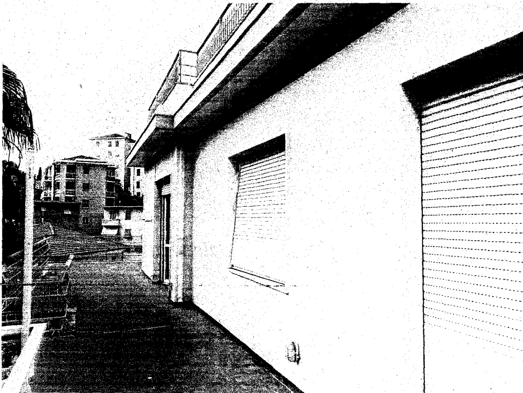
FOTO TERRAZZA DAL LATO EST