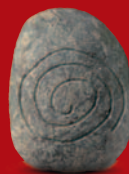
Testi: D. Bagnaschino, S. Zanella Cartine: S. Zanella - Stampa: Graphicolor - 2005

LA MEMORIA DELLE ALPI LA MÉMOIRE DES ALPES GEDÄCHTNIS DER ALPEN