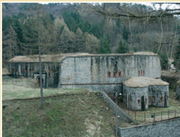
Forte Centrale di Nava

Le secteur d'action des batteries couvrait non seulement la zone du col proprement dite, mais aussi les vallées et sentiers latéraux et rejoignait l'action exercée par les ouvrages de Saccarello et de Zuccarello, afin de créer une ligne de défense quasi continue le long des Alpes Ligures.