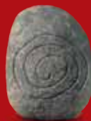
Testi: D. Bagnaschino, S. Zanella Cartine: S. Zanella - Stampa: Graphicolor - 2005

LA MEMORIA DELLE ALPI LA MÉMOIRE DES ALPES GEDÄCHTNIS DER ALPEN