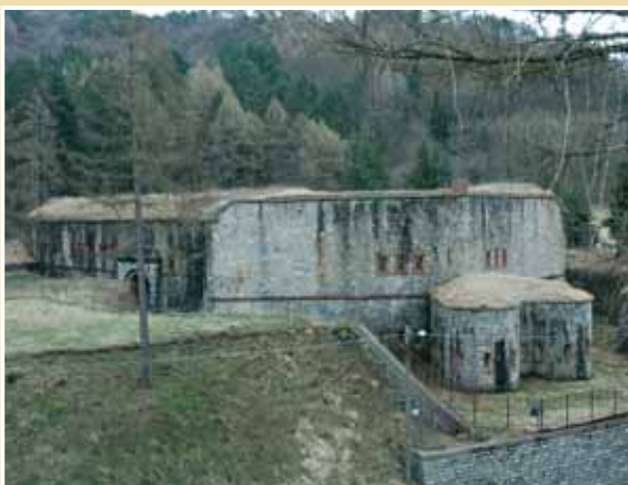
Forte Centrale di Nava

Il settore di azione delle batterie copriva, oltre alla zona del colle vera e propria, anche le vallate ed i sentieri laterali, saldandosi con l'azione svolta dalle opere del Saccarello e di Zuccarello, al fine di creare quasi una linea continua di difesa lungo le Alpi Liguri.