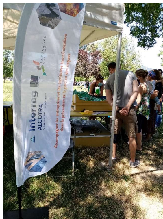
Foto del Roll-Up e di un Beach-Flag

Descrizione: realizzazione di materiali di comunicazione da utilizzare negli eventi del progetto Pays Résilients. Il Roll-up è per CCI NCA per uso interno e i Beach-Flag sono per CASA e CACPL con un possibile uso esterno.